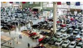
寮步鎮:汽車銷售、電子資訊產業