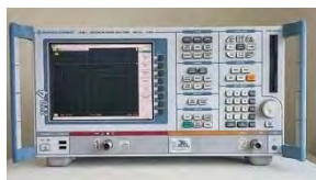
塘廈鎮:電子電源、高爾夫產業、家用電器