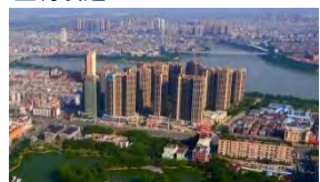
石龍鎮:電子資訊業、醫藥食品、文化創意