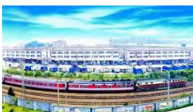
樟木頭鎮:塑膠產業、高端裝備、數控電子