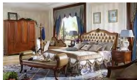
大嶺山鎮:傢俱出口