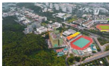
香港中文大學(深圳)下園鳥瞰圖

2022年，港中大(深圳)各大項目工程先後展開，道揚書院及田徑場體育設施已落成，二期校園建設即將竣工，計劃今年8月投入使用。按三級甲等醫院標準建設的古華醫院，建成後將作為我校醫學院直屬教學與科研一體醫院，目標成為大灣區一流醫院。香港中文大學(深圳)音樂學院建設項目是深圳市“新時代十大文化設施”之一，目前和醫學院項目一起，都在穩步推進建設進程。