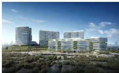
香港中文大學(深圳)醫院 (深圳市吉華醫院)規劃效果圖

香港中文大學（深圳）醫學院於 2021 年 8 月正式成立，加拿大健康科學院院士、世界權威的心臟外科麻醉專家、麻醉和圍手術期循證醫學研究專家鄭仲煊教授任醫學院創院院長。醫學院以培養兼具國際視野和人文情懷的卓越醫學創新人才為目標，借鑒香港中文大學醫學院國際一流的辦學基礎和教學經驗，充分吸收國內外醫學院的先進辦學理念，積極探索深港融合的醫學教育新模式，建立本、碩、博人才培養體系。醫學院將充分發揮學校三個諾貝爾獎科學家研究院與大數據研究院在人工智慧、生命健康等領域的科研和人才優勢，推動醫工結合、醫理結合和轉化醫學發展，致力於打造兼具先進醫療服務、高端醫學人才培養和創新醫學研究三大功能的國際化醫學體系。臨床醫學本科專業於 2021 年招收首屆新生，並將分階段開設公共衛生、護理學、中醫學等專業，最終計劃醫學院在校生總規模超過 6000 人。