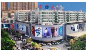
虎門鎮:服裝業、電子商務