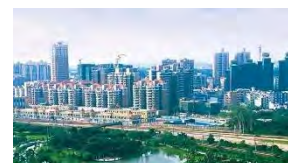
常平鎮:毛織玩具、塑膠製品、 高端電子、LED智慧應用、 生物製造