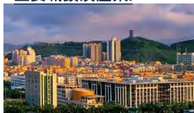
鳳崗鎮:電子資訊、紡織服裝和現代服務業

松山湖科技產業園區： 做大做強IT產業的同時，大力發展光電產業、生物技術產業、環保產業、裝備製造業等有巨大潛力的新興產業和高科技產業。